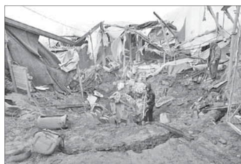
Здание в Газе, разрушенное израильскими ВВС

Позицию Саара разделил и член партии «Кадима» Шауль Мофаз,