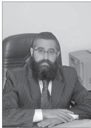
Рав Авроом Вольф, главный раввин Одессы и Юга Украины

Пишите мне: zhblinder@gmail.com , читайте посты в Twitter: @zhblinder и в ЖЖ: http://zvika.livejournal.com/