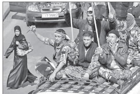
Сторонники короля Абдаллы на улицах Аммана

Иран за 2000-е годы скупил большие объемы золота на мировых рынках, чтобы снизить зависимость от американского доллара. Об этом, как выяснил сайт Wikileaks, американским дипломатам в 2006 году заявил представитель Банка Англии Эндрю Бейли. Цитаты из Бейли приводит газета «Файнэншл таймс».