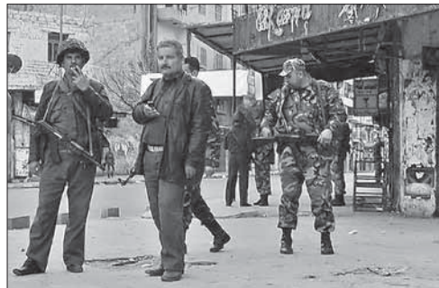
Сирийский армейский патруль в Латакии

Заявление «Исламского джихада» поступило вскоре после того, как по израильскому городу Беер-Шева в сорока километрах от сектора Газа была нанесена серия ударов. Агентство «Франс пресс» отмечает, что обычно группировки, ведущие борьбу против Израиля, атакуют города, расположенные гораздо ближе к границам Газы. Также серия ракетных ударов была нанесена по городу Ашдод. Ответственность за обе атаки взял на себя «Исламский джихад».