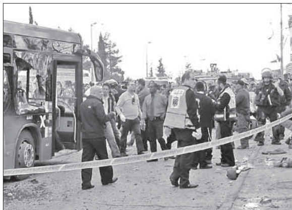
Полиция и спасатели работают на месте взрыва

И ХАМАС, и «Исламский джихад» поприветствовали теракт в Иерусалиме, однако на себя ответственность за него не взяли. Не