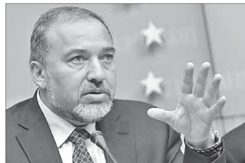
Министр иностранных дел А. Либерман

В настоящее время несколько западных стран задействовали свои ВВС и ВМС в операции против ливийского режима. Применение силы с их стороны было санкционировано Советом Безопасности