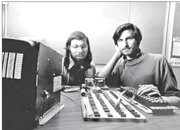
Стив Джобс (справа) и Стив Возняк. Середина 1970-х

Друзья управились с заказом за десять дней. Рабочий цикл был следующим: забрать детали, отнести их в гараж, напаять на платы, протестировать платы, отнести их в магазин и получить деньги. Местные компьютерные журналы в те времена публиковали списки новых компьютеров, и Apple I уда-