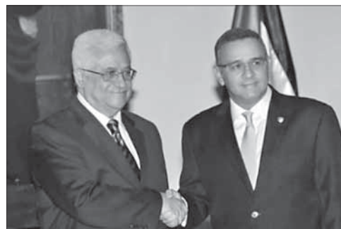
М. Аббас (слева) и президент Сальвадора М. Фунес

После разговора с Аббасом президент Фунес высказал по-