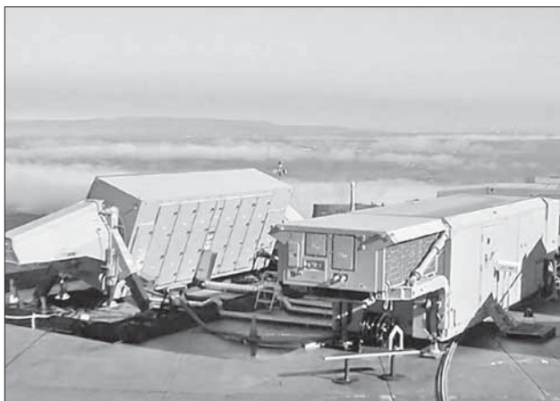
Радар американской системы противоракетной обороны

рили по оккупированным территориям, если однажды сионистский режим предпримет против нас агрессию. Вот почему