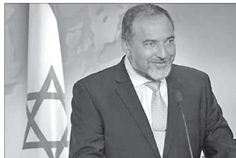
Глава МИД Израиля Авигдор Либерман

Кроме того, говорится в директиве, государство, претендующее на членство в ООН, должно признавать международные законы, соблюдать права человека и стремиться к миру. Всем этим требованиям, по мнению израильского МИДа, гипотетическое палестинское государство не отвечает.