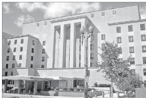
Здание госдепартамента США в Вашингтоне

Далее в директиве последовательно доказывается, что палестинское государство не соответствует требуемым критериям. Что касается населения, то позиция руководства Палестинской автономии по этому вопросу представляется как противоречивая: претендуя на то, чтобы представлять интересы всех палестинцев, оно в то же время не намерено предоставлять гражданские права палестинским беженцам, в том числе живущим в секторе Газа и на Западном берегу Иордана.