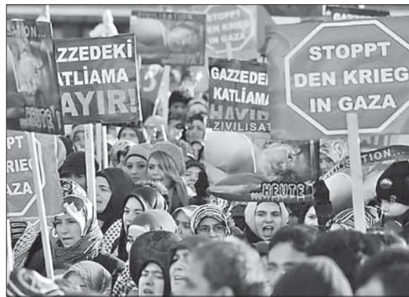
Прохамасовская манифестация в Дуйсбурге

тие около 40 тысяч человек. Самая крупная манифестация, собравшая 10 тысяч человек, состоялась в Дуйсбурге. Она была организована Исламским обществом Милли Герюс, которое, кстати, находится под пристальным наблюдением Федерального ведомства по охране конституции (германской контрразведки), так как существуют сильные подозрения в ее приверженности идеям радикального исламизма. Лозунги в Дуйсбурге были те же, что и в Париже, но с некоторыми вариациями: «ООН + ЕС + США = Израиль», «Остановите геноцид» и т. д. Многие потрясли куклами, перевязанными бинтами с пят-