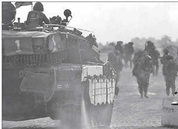
Израильские сухопутные войска входят в Газа

Есть еще несколько вариантов, которые могут утвердить преимущество Израиля. Например, возвращение Израилю контроля над «филадельфийским коридором», сохранение ограниченного контингента в «буферной зоне», контроль над КПП «Рафиях» и «Керен