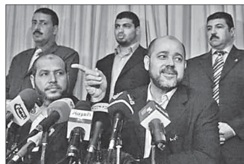
Пресс-конференция ХАМАСа после переговоров в Каире

являются прекращение огня со стороны подразделений ЦАГАЛа, а также снятие блокады с сектора Газа. Для Израиля эти требования пока неприемлемы. В свою очередь, ХАМАС отвергает возможность размещения на подконтрольных ему территориях международных наблюдателей и, тем более, войск. Кроме того, по последним сообщениям, против перемирия с Израилем палестинцев настраивает Иран, выступающий за продолжение войны в секторе Газа.